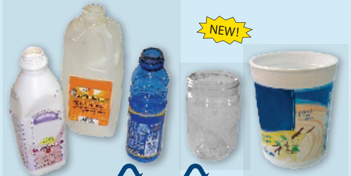
Plastic bottles, jugs, tubs & screw-top jars (no lids, no #7 PLA compostables) Botellas y envases de plástico (no tapas, no #7 PLA compostables)