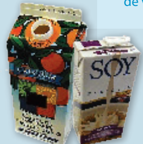
Milk cartons & drink boxes (no foil pouches) Cajas y envases de papel de leche y jugo (no bolsas hechas de aluminio)