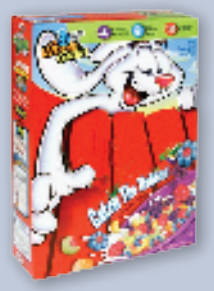
Paperboard boxes Cajas de papel cartón