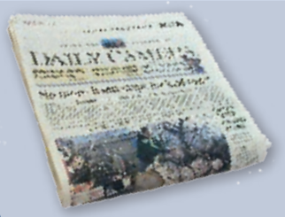
Newspapers & inserts Periódicos y propaganda insertada