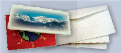
Opened mail & greeting cards Correo abierto y tarjetas de felicitación

You can now place all recyclables in one bin!