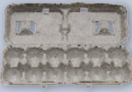
Paper egg cartons Envases de cartón para huevos