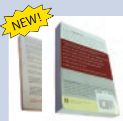
Paperback books libros de tapa blanda