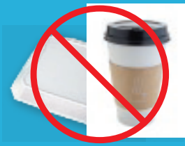
Styrofoam® or paper takeout containers or cups