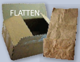
Corrugated cardboard & brown paper bags Cartón corrugado y bolsas de papel marrón