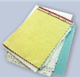
White or pastel office paper Papel de oficina color pastel o blanco