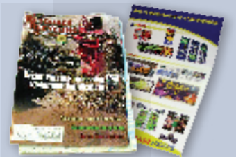
Magazines & brochures Revistas y folletos