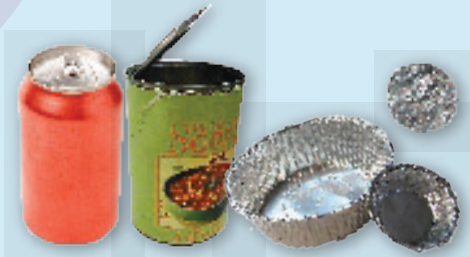
Cans (do not crush), clean, balled aluminum foil & pie pans Latas (no aplastarlas), papel de aluminio limpio en un globo