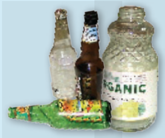
Glass bottles & jars Botellas y jarras de vidrio