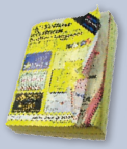
Phonebooks Guías de teléfono