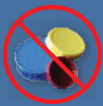
plastic caps or lids