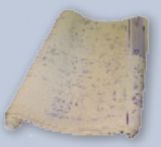
Blueprints Planos de proyecto