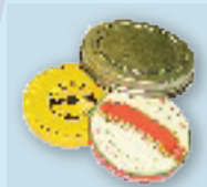
Loose metal jar lids & steel bottle caps Tapas de metal para frascos